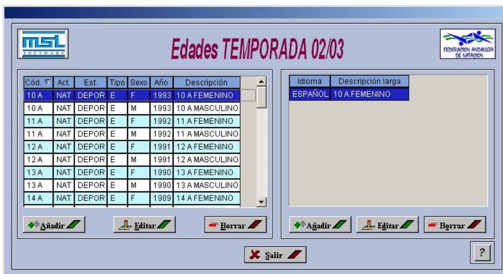
Pantalla 1: Edades de la Temporada activa.