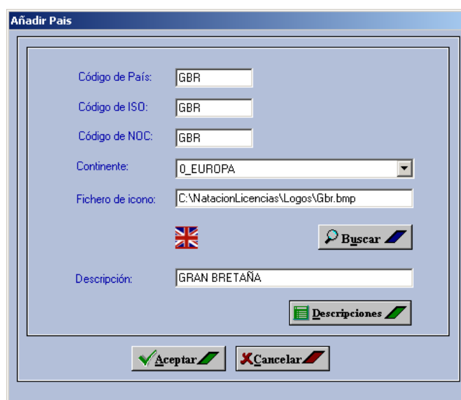
Pantalla 2: Añadir País.