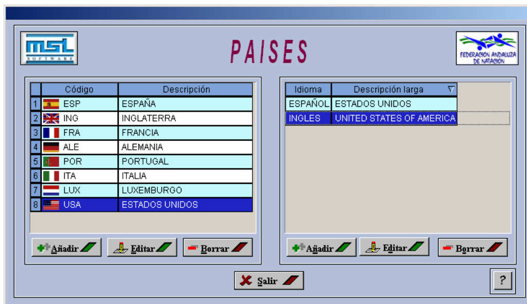
Pantalla 1: Países.