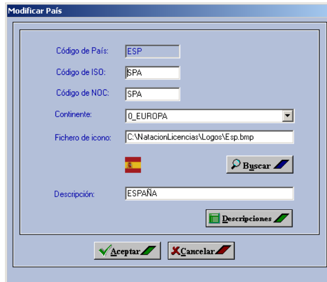
Pantalla 4: Modificar País.